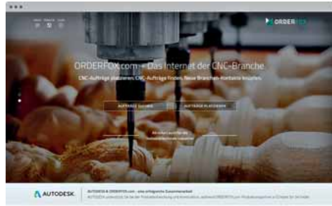
Orderfox.com wurde speziell für die CNC-Branche und deren Bedürfnisse entwickelt. Auf der Plattform können Mitglieder Aufträge platzieren bzw. suchen und neue Kontakte knüpfen